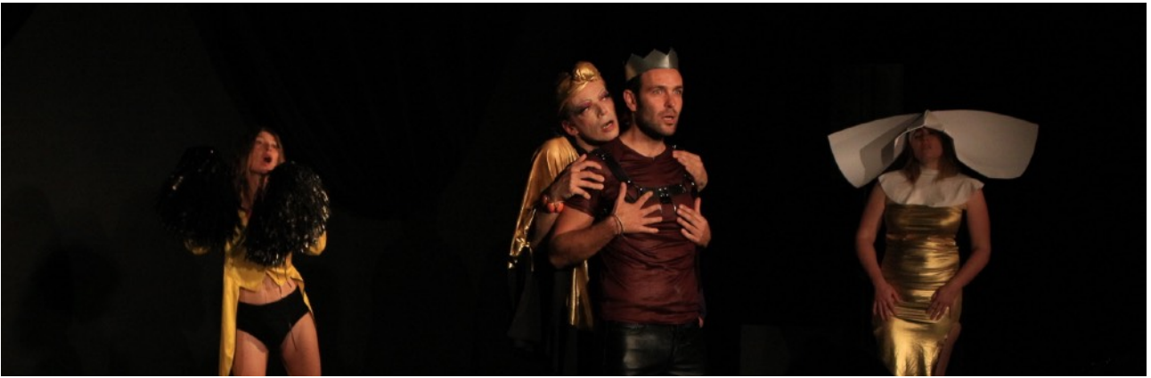
Les Vedettes chambériennes / L'Endroit-Malraux à Chambéry / Octobre 2021