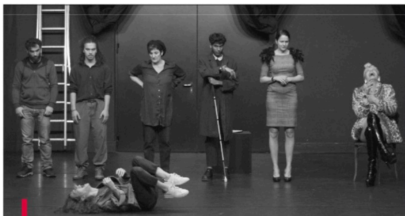
Une des scènes de "Vedette(s)" qui met du théâtre dans le théâtre.

Une farce donc... Un monde entre Genet et le Gorki des "Bas-fonds". Une tragédie