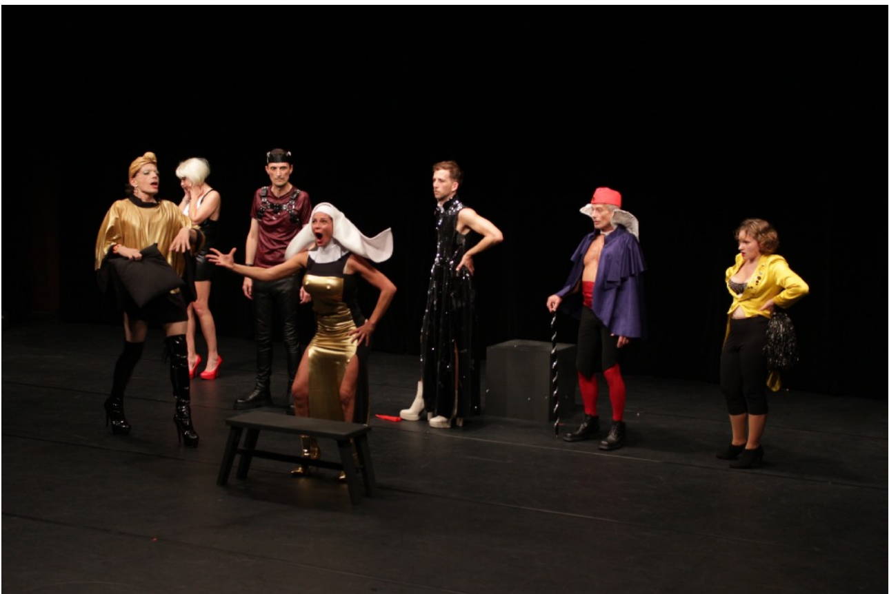
Les Vedettes marseillaises | Création | Théâtre Joliette octobre 2022

Alors que l'acteur principal se transforme en Miss Poutinka, sous le regard troublé du technicien, chacun endosse son rôle pour donner corps à des figures troubles. L'histoire de ce royaume despotique ne laissera personne indifférent.